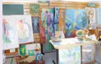
Kunst & Schmuck