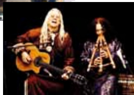
Musik & Klang