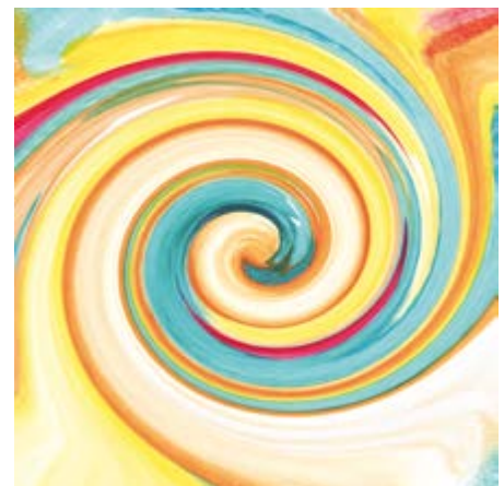
Energiebild (Textildruck) „Ich Bin“ von Carina Zais