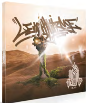
Neues Album LEUCHTTÜRME www.seommusic.de